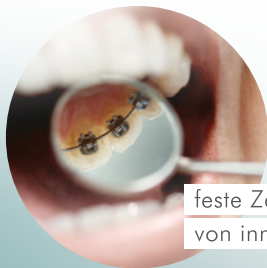
feste Zahnsperange von innen

Ein großes Dankeschön an unseren fantastischen Trainer Marc! // NW