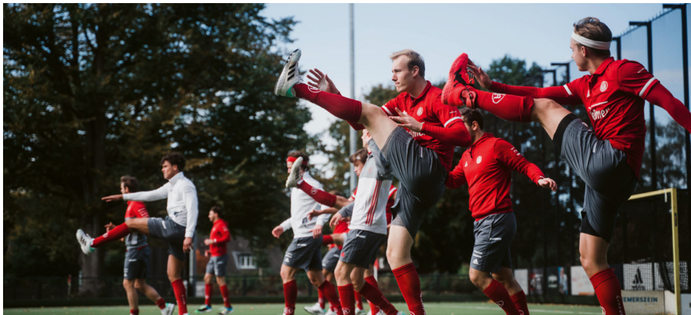
Eine absolute Einheit: dieses Jahr soll es klappen mit dem Final4.