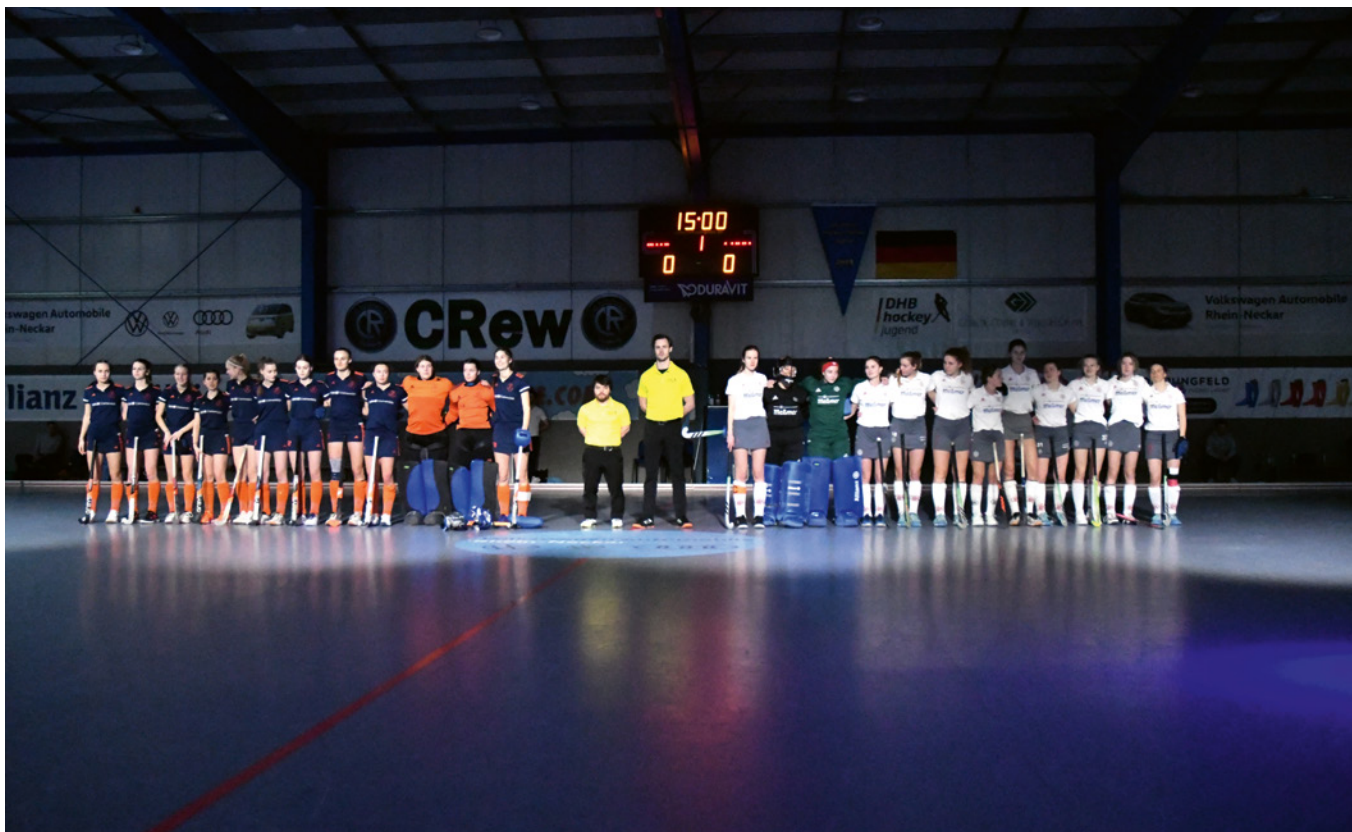
WU18 beim Lineup vor dem Spiel um Platz 3 gegen den Wiesbadener THC.

Das gelang gut und wir gewannen das Halbfinale mit 2:0. Ein wichtiger Schritt da man neben der Chance auf den Wimpel vor allem auch schon das Ticket für die Endrunde sicher hatte.