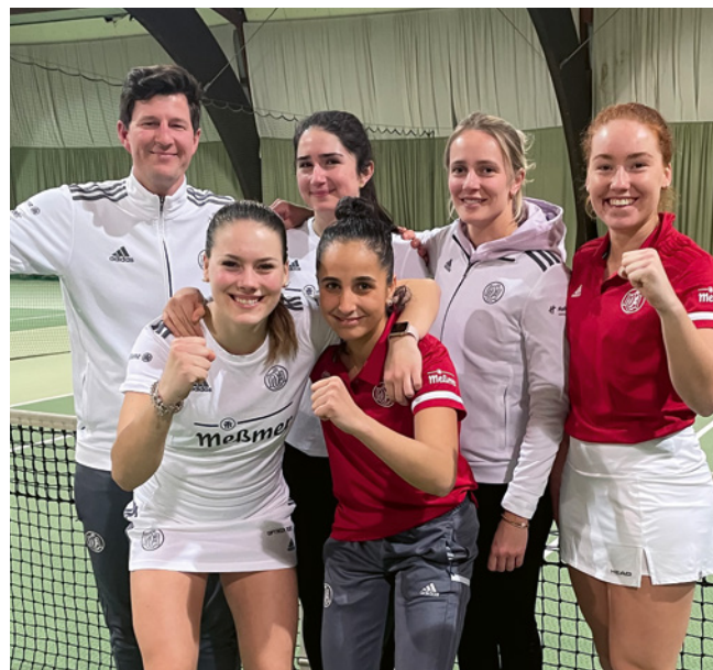
Glückliche Gesichter trotz der knapp verpassten Meisterschaft.

Mannschaft. Zu keiner Zeit konnten die Trainer auf alle Personalien zurückgreifen, was in erster Linie aber auch daran liegt, dass der Kader so hochkarätig besetzt ist. // MK