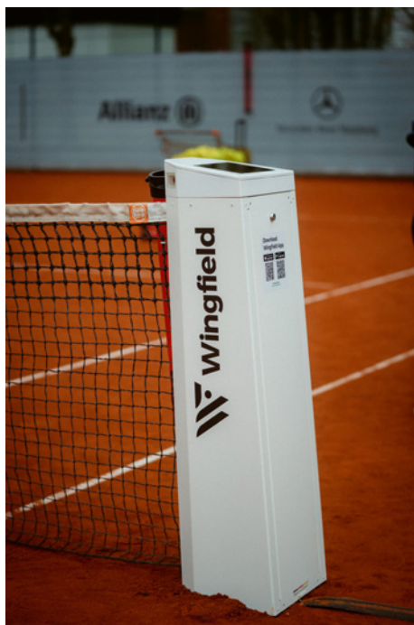
Wingfield auf Platz I2 am Rothenbaum

Haben Sie das neue System schon getestet?