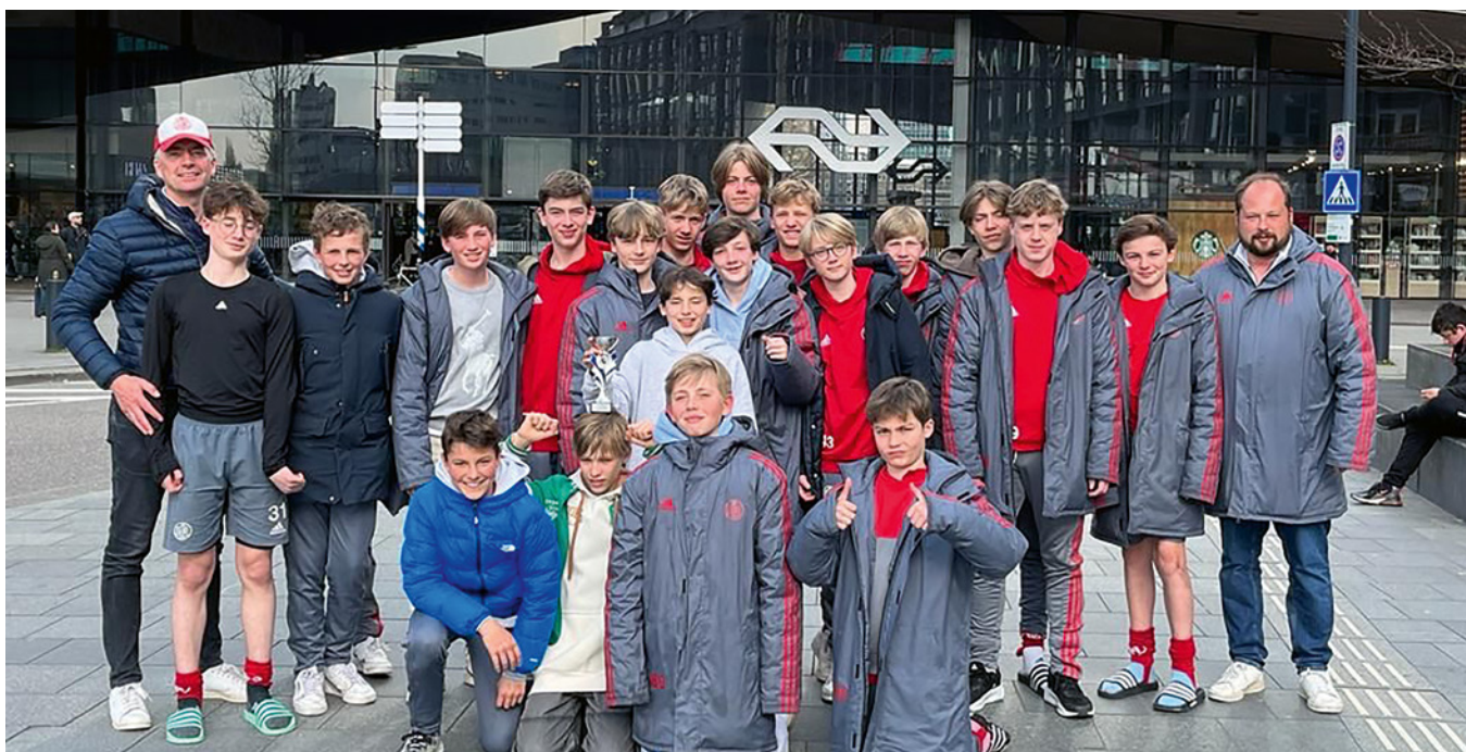
Ab in die Vorbereitung der neuen UI4-Saison

Zum Vorbereitungsturnier in die Niederlande