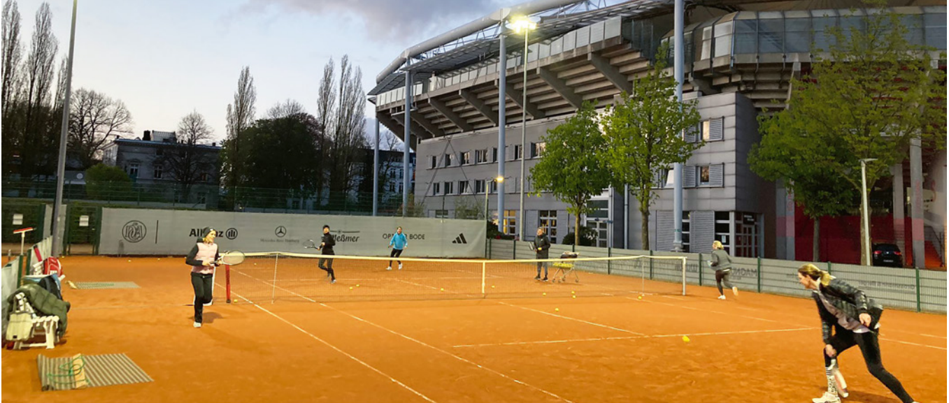
Momentaufnahme vom Tennis „Afterwork Tennis“ immer Mittwochs ab 19 Uhr

Mit neuer Konzeption in die Sommersaison