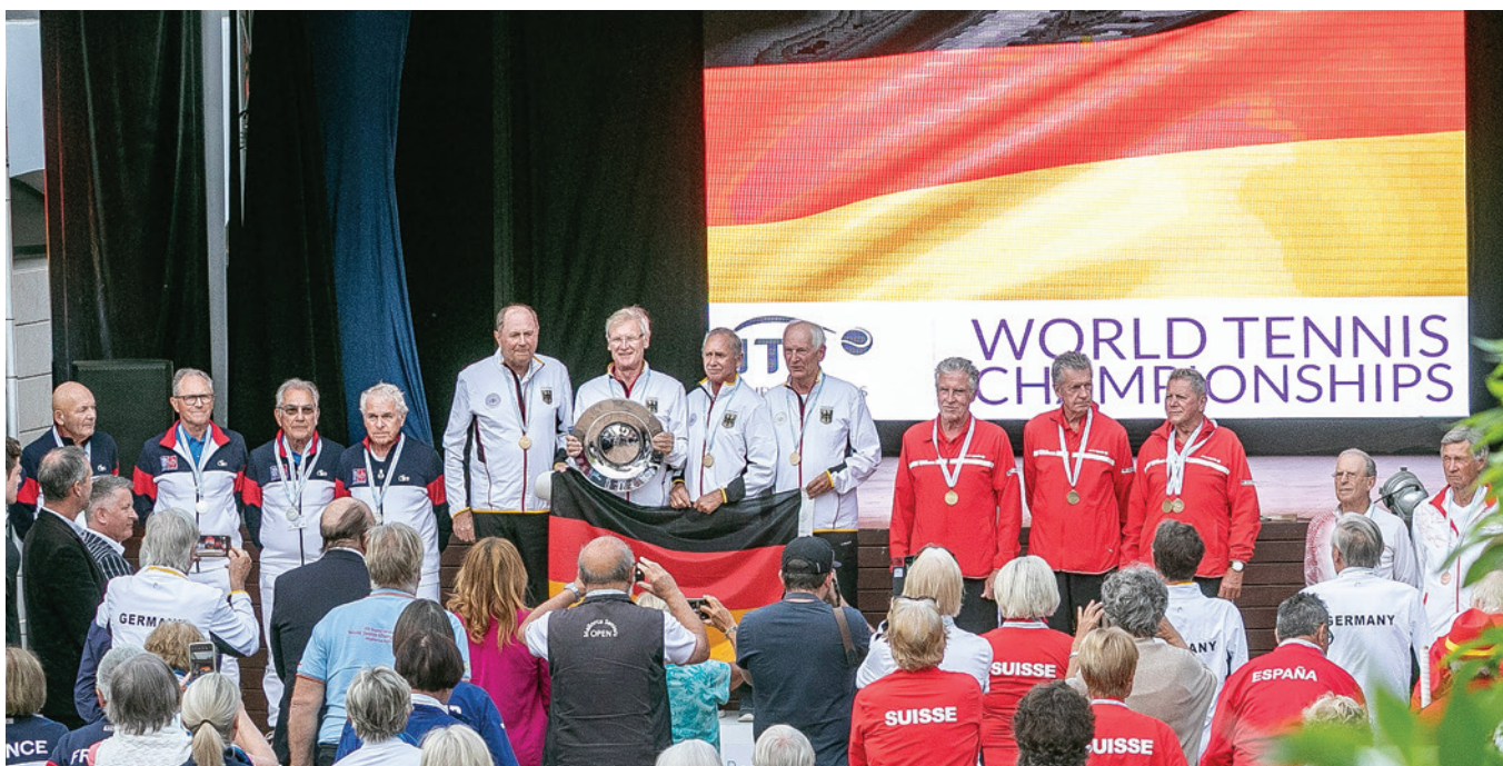
Deutsche Weltmeister bei den Herren: Alexander Zverev – und die Teams der Herren 70, 75 (Foto), 80 und 85!

Die 25. Mallorca Tennis Seniors Open fanden 2021 wieder in Font de Sa Cala statt, - leider mit einem Jahr „Verspätung“ aufgrund einer Epidemie, die ihren schönen Namen nicht verdient.