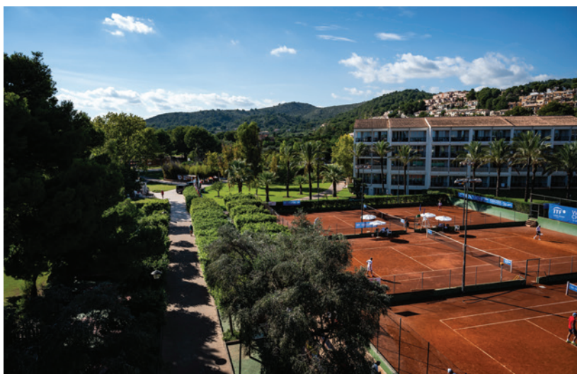
Die Tennisanlage in Font de Sa Cala