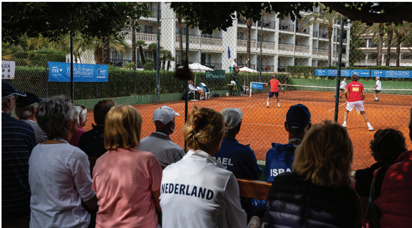
Internationale Spiele – internationale Zuschauer