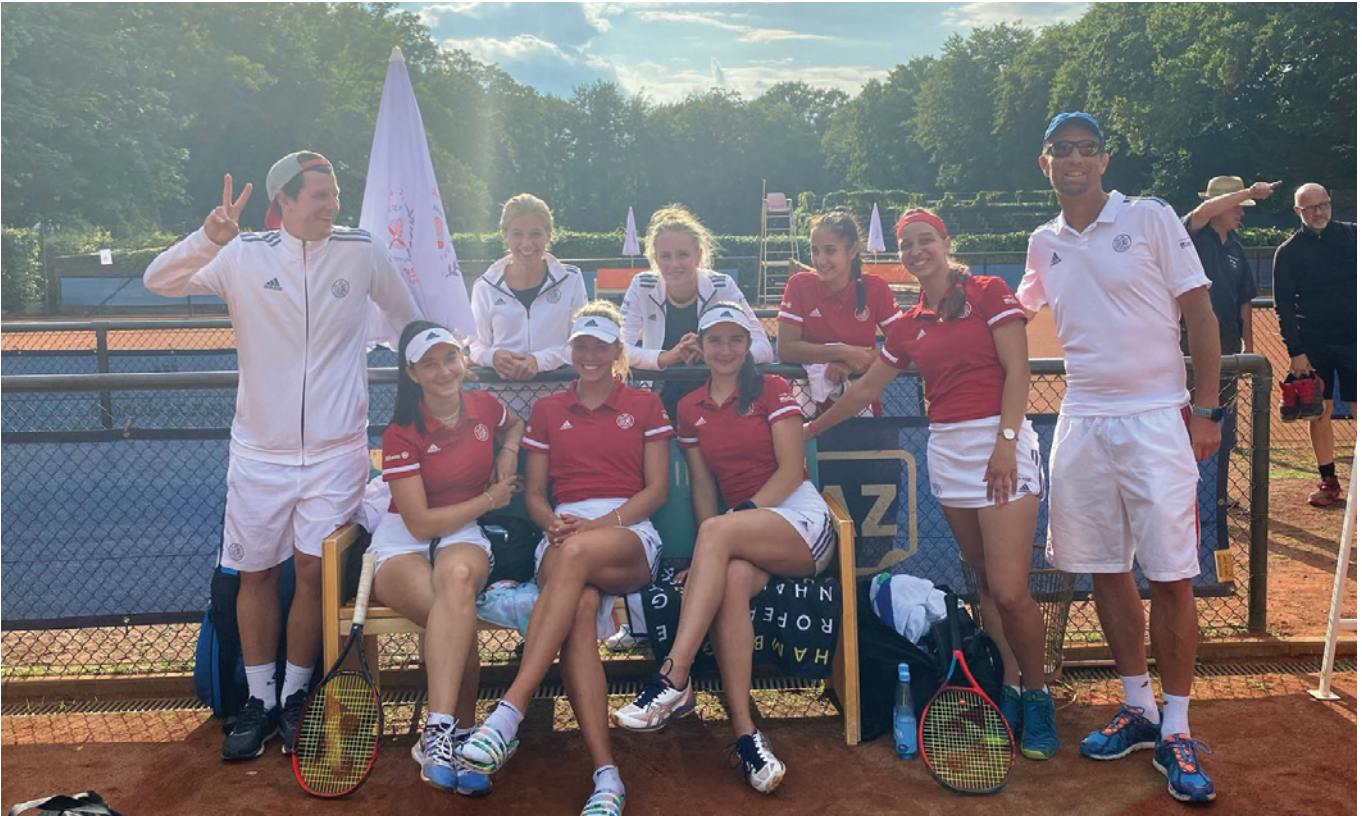
Glückliche Damen nach erfolgreicher Sandplatzsaison. Jetzt geht es in die Halle!

wird deutlich, wie hoch das Niveau ebenfalls in den Winterligen ist. Angestrebt wird der Klassenerhalt für das zweite Team, was angesichts der Stärke der Konkurrenten kein leichtes Unterfangen darstellen wird.