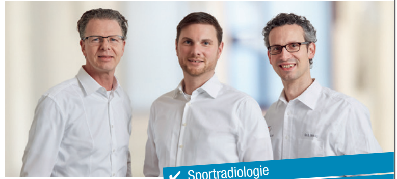
Radiologie am Rothenbaum

Hansastraße 2-3 20149 Hamburg Tel 040 - 32 55 52 - 109 rob@radiologische-allianz.de