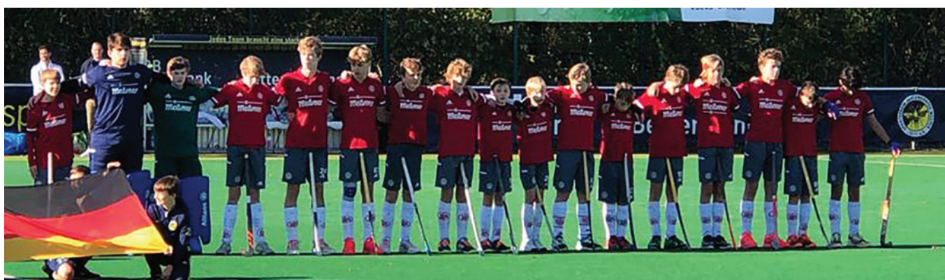
U14 bei der Nationalhymne vor dem finale gegen die Wespen.

Ein Traum war bereits mit dem Einzug ins Finale in Erfüllung gegangen. Was nun folgte, war nur noch Zugabe. Entsprechend gelöst, aber dennoch fokussiert gingen die Jungs ins Finale am nächsten Tag gegen die Heimmannschaft des Ausrichters der Endrunde, die Zehlendorfer Wespen. Es war ein hochklassiges, ausgeglichenes Spiel, bei dem es hin und her ging. Bereits nach 2 Minuten gingen die Wespen nach einer